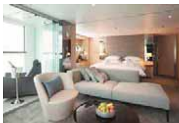
Royal o Panorama Suite

Este elegante café está disponible durante el día con una gran selección de cafés y tés, canapés y dulces para los más golosos.