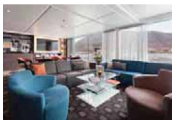
Panorama Lounge & Bar

La terraza superior cuenta con asientos y tumbonas para relajarse y disfrutar de un cóctel y de las magníficas vistas.