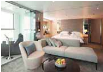
Royal o Panorama Suite

Este elegante café está disponible durante el día con una gran selección de cafés y tés, canapés y dulces para los más golosos.