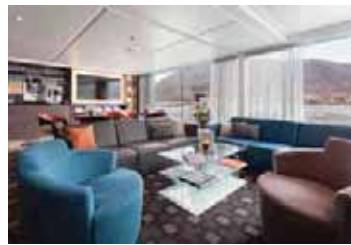
Panorama Lounge & Bar

La terraza superior cuenta con asientos y tumbonas para relajarse y disfrutar de un cóctel y de las magníficas vistas.