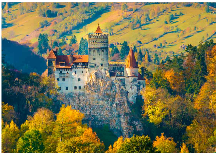
Rumania, Cárpatos y Transilvania Cód. Iti. 551

Día 1.- Bilbao- Bucarest (mp) Día 2.- Bucarest - Sibiu - Medias/Sighisoara (350 kms.) (mp o pc) Día 3.- Medias/Sighisoara - Cluj Napoca (150 kms.) (mp o pc) Día 4.- Cluj Napoca- Turda - Targu Mures (130 kms.) (mp o pc) Día 5.- Targu Mures - Biertan - Sighisoara - Brasov (200 kms.) (mp o pc) Día 6.- Brasov - Prejmer - Bran - Poiana Brasov (120 kms.) (mp o pc) Día 7.- Brasov - Sinaia - Bucarest (260 kms.) (mp o pc) Día 8.- Bucarest- Bilbao